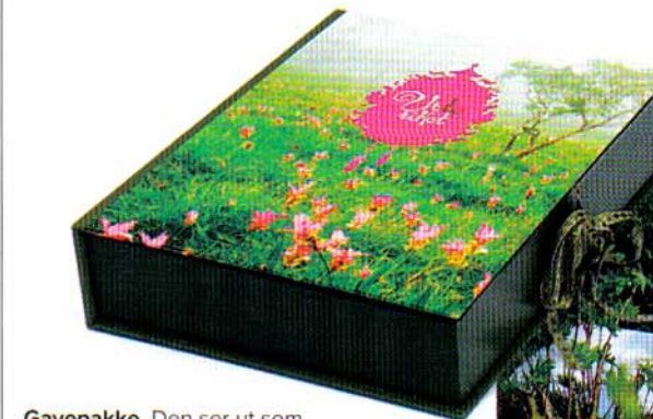
Gavepakke. Den ser ut som en bok, men inneholder et utall urter. Innpakningen er det ingenting å si på.