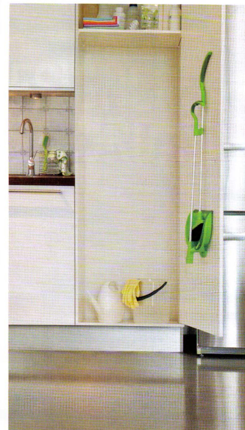
Nyhet: Sammenleggbart feiesett