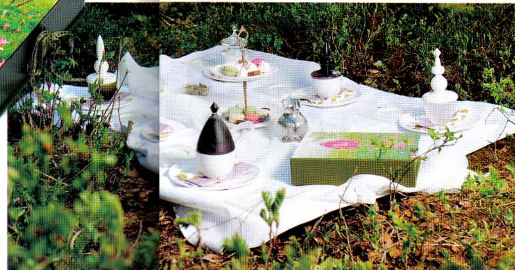
Pent dekket. Hvem trenger mat når man kan dekke til te i slike omgivelser?