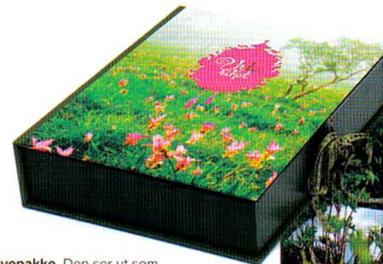
Gavepakke. Den ser ut som en bok, men inneholder et utall urter. Innpakningen er det ingenting å si på.