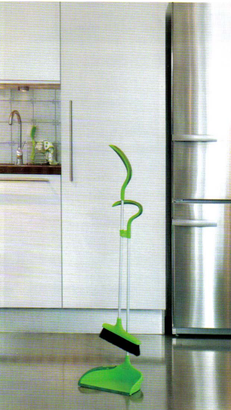
Nyhet: Sammenleggbart feiesett