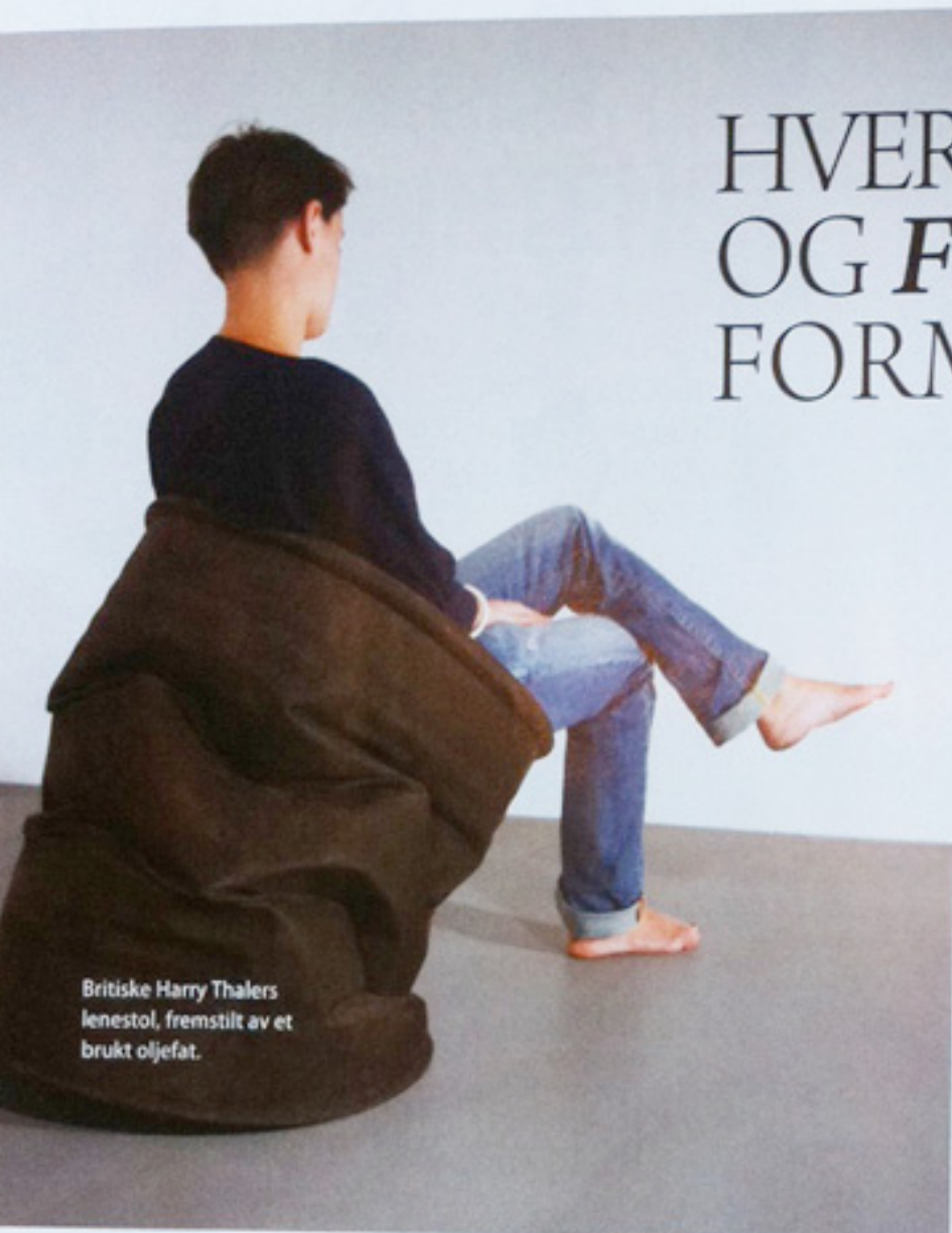
Britiske Harry Thalers lenestol, fremstilt av et brukt oljefat.

TEKST: WILLEAM VENDEL