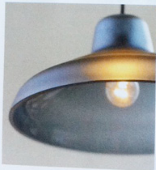
Evergreen, pendel i glass, formgitt av Vibeke Skaar og Jens Praet for Northern Lighting. www.northernlighting.no