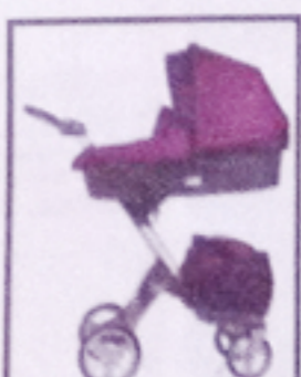
FOR DE ALLER MINSTE: Skjarp Norge barnstol.