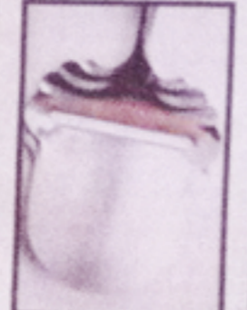
NORSK OPPFINNELSE: Otscheviken er det utvandringsstol.